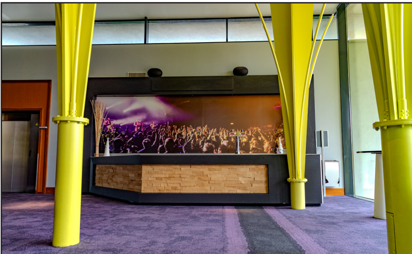
De bar op foyer 2 (gesloten).