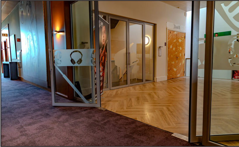
Klapdeuren richting het trappenhuis.

Foyer 2 dient als rustige ruimte voor het prikkelarm bezoek. In de foyer kun je voor-, tijdens en na de voorstelling rustig bijkomen. Vanaf foyer 2 kun je het balkon betreden naar je zitplaats. De foyer is een open ruimte, er kunnen geluiden uit de rest van het gebouw te horen zijn. We raden je aan om een noise cancelling koptelefoon of oordoppen mee te nemen als je dat wilt. In foyer 2 zijn gratis oordoppen beschikbaar. Er staat een (onbewaakte) kapstok op foyer 2. De bar is gesloten.