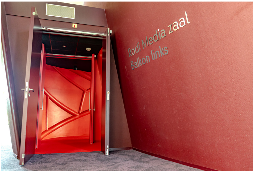
In- en uitgang naar de Rodi Media zaal vanaf de foyer 2.

De balkon plaatsen zijn te bereiken via foyer 2.