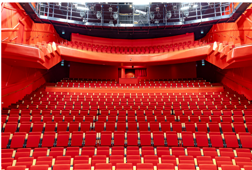
Overzichtsfoto vanaf de Rodi Media zaal vanaf het podium.