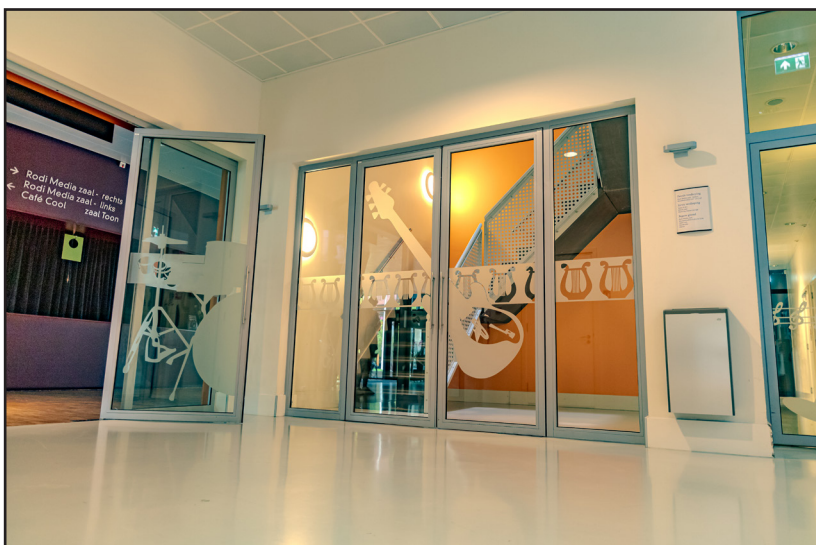
Het trappenhuis tegenover de garderobe.