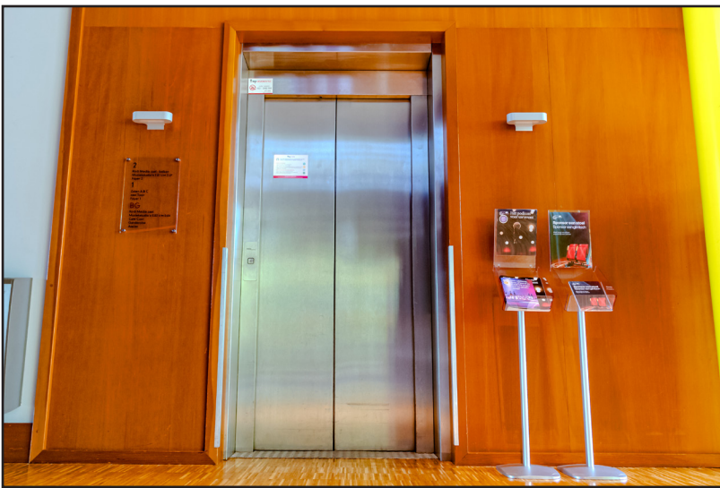
De lift bevindt zich links van de Servicebalie.

Links van de lift, door de klapdeuren, is het trappenhuis. Via het trappenhuis kom je bij de rustige ruimte foyer 2 op de tweede verdieping. Hier is ook de ingang naar het balkon.