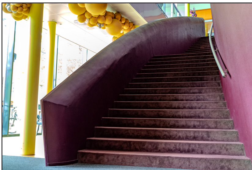
De hoofdtrap bevindt zich tegenover de Servicebalie.