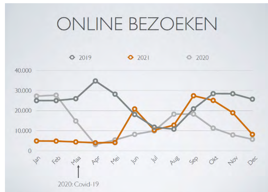
Online bezoeken per maand, in 2019, 2020 en 2021

In 2021 hadden we 145.480 bezoeken op de website – een daling van 7% ten opzichte van 2020.